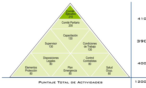
MÓDULOS DEL PROGRAMA EMPRESA COMPETITIVA